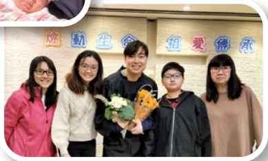
作者（中）經歷上帝的真實，接受浸禮以示信靠，得親友到賀。