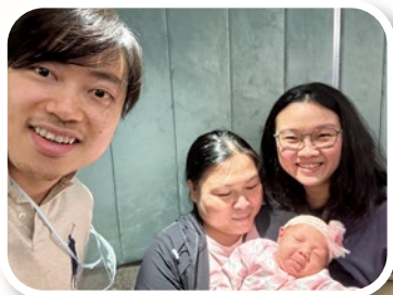
作者（左一）與岳母、太太（右一）及初生女兒

之後太太接二連三經歷流產，在難過中我抱怨上帝為何不答允我們的祈求。上帝卻用別的方式回應我：祂藉着教會弟兄姊妹的陪伴，給我們感同身受的關懷和支援，又賜我們一位很好的基督徒醫生，曾勉勵我們說：「不要氣餒，要常存盼望，要相信上帝會在最好的時機給我們最好的禮物。」是的，上帝的時間我們不曉得，甚麼是最好我們也不知道，唯獨祂知道。因此我不再問為甚麼，而是認真地認識這位真實存在的上帝。