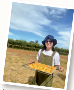
作者經歷上帝所賜非一般的父愛