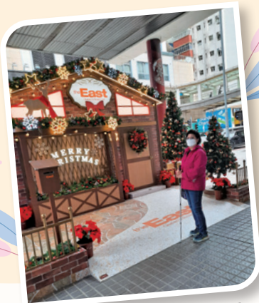
視障無損作者以心靈感知身邊人需要，並傳遞上帝的愛與盼望。

三成視力。我不但要重新學習如何起居飲食，更要忍痛辭去心愛的傳道工作，人生驟然掉進萬丈幽谷。初時我很沮喪，問上帝為何會這樣？因為服侍祂是我生命的重心，沒想過會戛然而止！「你還信我嗎？還跟從我嗎？」那時上帝反問我，我不再懷疑：「我信，死也要跟從！」接着，祂讓我接觸到心光恩望學校，有機會參與服侍視障和智障學生。那些小朋友集中力低，與他們說話時內容不能太複雜，也不能說得太快。在服侍中我感悟到萬事互效力：在我最低沉時遇見他們，令我反思自己雖然只剩三成視力，卻也算不得甚麼難關！這經歷強化了上帝給我的使命——這世界需要愛……要多付出愛，幫助別人。