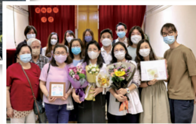
作者(前排左三)藉浸禮與親人朋友分享跟隨上帝的喜悅