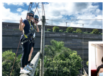
作者(前)在繩網活動中難忘與上帝同享歡欣之情