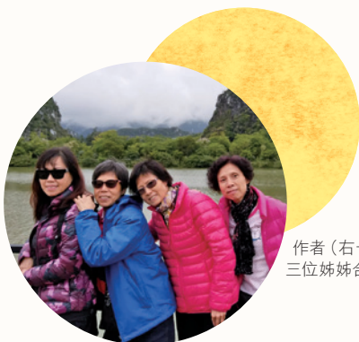
作者（右一）和三位姊妹合照

轉冷轉差的一天，也就是老媽舉行安息禮拜的那個早上（老媽在第五波疫情爆發前幾天因病離世），我到政府指定確診人士就診的柏立基診所看醫生。而在老媽的安息禮拜舉行前一星期內，大姊和同住的家人先後染疫，我也在安息禮拜前一天確診。當時確診人數每日數以萬計，急症室出現人滿之患，長者和兒童死亡率急升！我和家人都十分徬徨無助！既要面對病患煎熬，又怕家人有事，老媽的安息禮拜又能否如期舉行呢？大家身心都承受着很大的重壓和愁苦！那時，我們除了倚靠藥物，也一齊起來祈禱，無論信與未信耶穌都一起禱告，同心求上帝醫治和拯救，教會的弟兄姊妹也為我們祈禱。