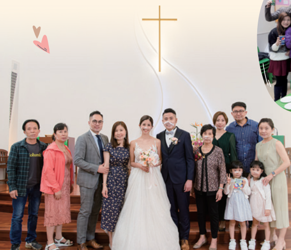
作者與太太踏上紅地毯，彼此相牽扶持，傳遞真愛的祝福。