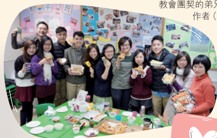
教會團契的弟兄姊妹與 作者（右三）溫馨同行

上帝的愛使我跨過一蹶不振的日子，聖經教導我如何活出美好的生活。例如以弗所書四章2至3