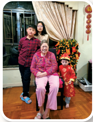
作者與孫兒們喜渡農曆新年