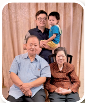
作者（前右）夫婦與兒孫合照