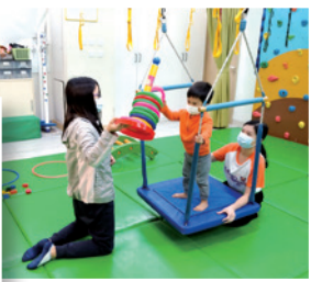
努力試中心導師耐心訓練自閉孩子

自閉孩子家長容易誤將問題焦點放在孩子身上，而忽略了更重要的關係。中心的家長課程兼顧孩子訓練及關係重整。