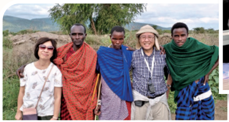
作者的太太去年中風，感恩禱告後得上帝醫治已能恢復活動能力。圖為作者夫婦在坦桑尼亞時與當地人合照。