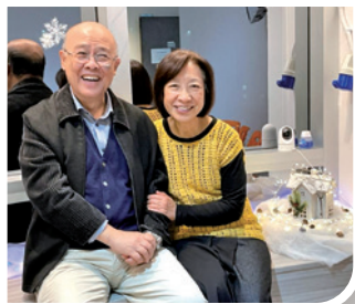
作者與太太結婚46週年合照