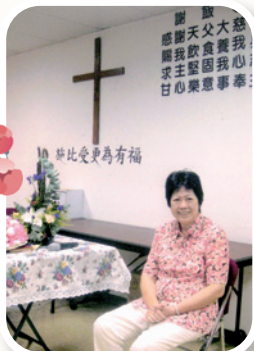
作者感恩能有對她不離不棄的天父同行人生路

苦難能化為祝福，實在是千真萬確。自大病後，我開始踏上信靠主的路。閱讀聖經多了，主的話語常感動我，也讓我明白耶穌基督為我們所成就的救恩何等寶貴。我領悟到，人生是短暫的，一切的人、事、物，都會隨生命終結而失去。惟有藉耶穌基督得着永生盼望，讓天父成為我們生命的主宰，生活才