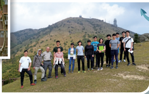
作者（左三）與港大學生們考察，推動保護大自然的信息。