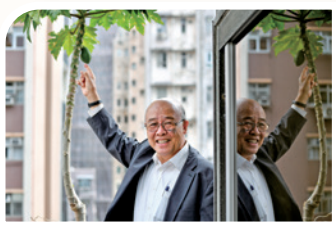
作者表示令種子結出果子的是創造天地萬物的上帝

耶穌說：「在世上，你們有苦難；但你們可以放心，我已經勝了世界。」（約翰福音十六33）人生難免遇到患難，然而我們可倚靠上帝，因祂知道我們的遭遇，必看顧尋求祂的人。去年太太突然中風，剎那間我手足無措，就立刻禱告，召救護車，她很快被送到醫院。當時我百感交集，若太太從此半身不遂，怎麼辦呢？於是繼續禱告，並發消息給弟兄姊妹，請他們代禱。翌日正想把太太的日用品拿去醫院，卻接到她來電說經醫生檢查後，手腳已恢復活動能力，多住一晚便可出院。至今她仍活動自如，實在感恩。