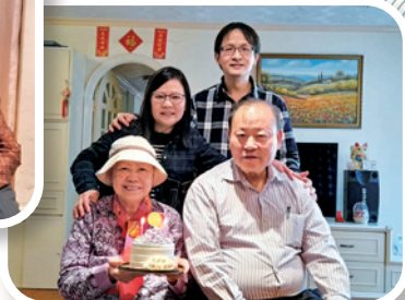
牧師、師母到訪時與作者（前左）夫婦合照。