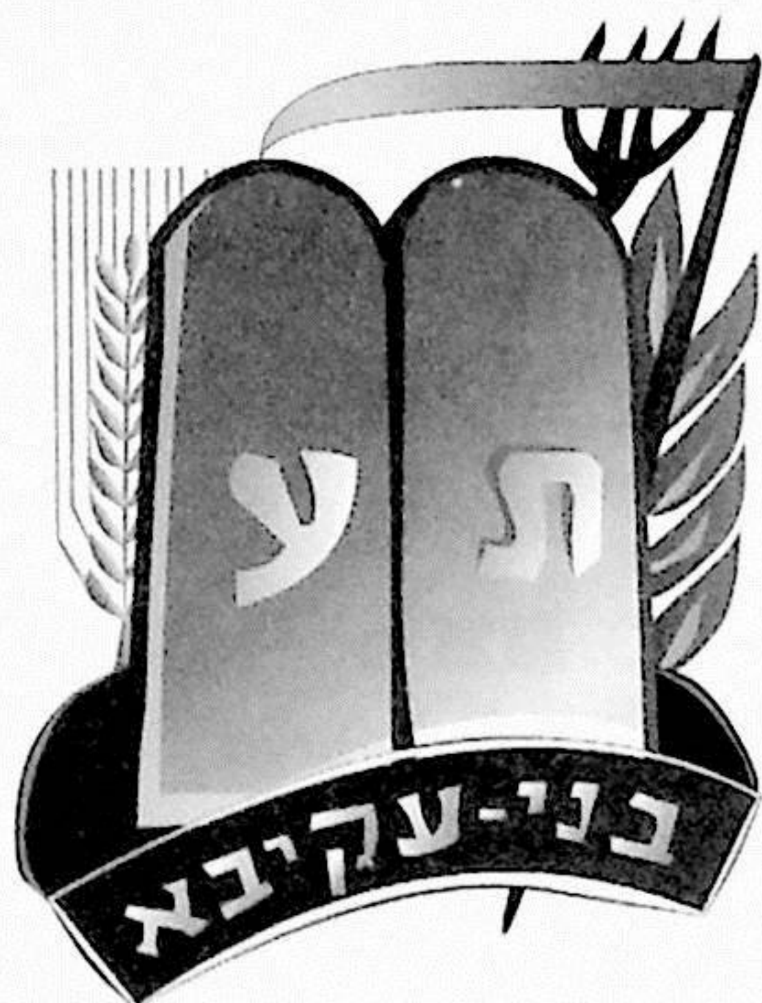
(圖二) [1.5] Bnei Akiva 的標記 右：Taf (ת) = Torah 神的話，左：Ayin (ע) = Avodah 工作。

工作是我們整個生命事奉神的一部分，就如猶太人 Bnei Akiva 社團的標記（見圖二），是由 Taf (ת) 和 Ayin (ע) 這兩個希伯來文組成的。Taf 是指 Torah 神的話；Ayin 是指 Avodah 工作之意，亦指「服事或敬拜神」。象徵每天的工作中要有神的話與工作同在，才能有健康平衡的工作和豐碩的收穫。