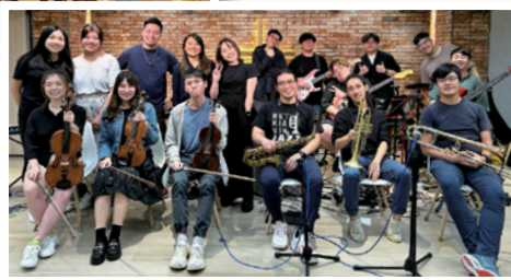
作者（前排右三）在香港參與的音樂會團隊