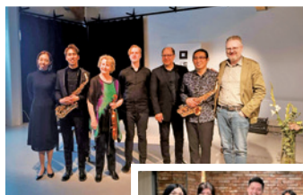
作者（右二）開心完成畢業音樂會

我將近四十歲了，活到這年紀只求心境自在。回顧過去，我的人生經歷過不同轉變：開始時我尋找自己——我究竟喜歡甚麼？要作甚