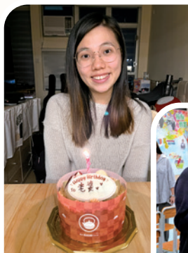
作者因與耶穌「講數」換來了新生