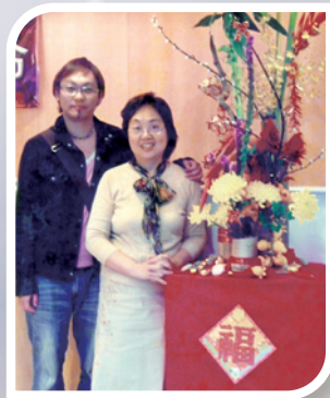
作者（右）經歷心靈的輕省與欣悅，也讓她的兒子（左）親見上帝大能。