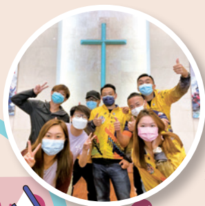
作者(中)與 WeCycle 同工 盡心服侍