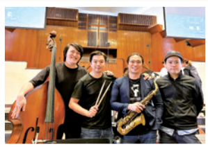
作者（右二）參與的教會樂隊