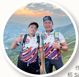
作者（左）感恩能與栢 Sir 一起服侍

信主以來，我沒再碰毒品，人生亦徹底扭轉。從放債者到戒賭中心朋輩輔導員，一切都是上帝的恩惠。親愛的讀者，在上帝裏有出路，願你勇敢踏上；祂必以一生的恩惠，帶領你走光明的人生。✉