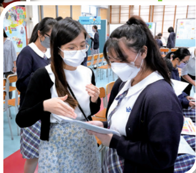
作者感悟其經歷讓她更能憐恤身旁友輩