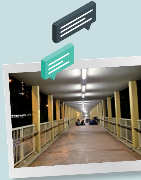
作者學習與貧弱者同行

發前大家先唱詩敬拜，當唱到「一天的難處一天當就夠了」時，我心裡有強烈的反彈想講粗口，因我的難處已當了四年！我不忿沒得上帝的祝福，竟在大家的歌聲中飲泣！