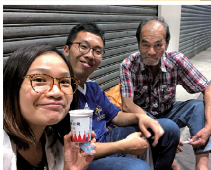
在 Carmen 心中的一個深刻片段，就是與阿彭（右三）在街邊吃雪糕。

他已陷入昏迷，我立即陪伴他進醫院……到最後，安息禮拜是我負責的，其間都沒有見到他的親人。」