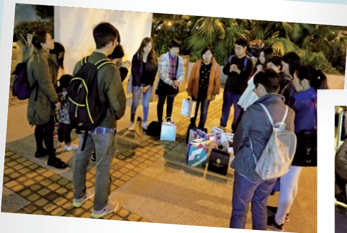
出隊服侍無家者前團隊同心禱告