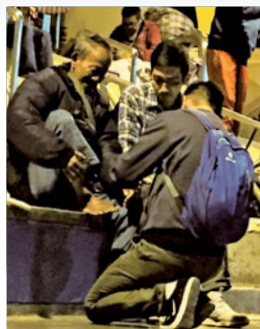
為伯伯皮膚爆裂的腳底塗藥膏

當晚回家細想，這位一無所有、只靠行乞度日的無家者亦能充滿盼望地活著，何況我這有家的人！想通後，我頓感豁然開朗。奇妙的是，探訪後我的拍攝工作量突然飆升，且大部分是新客戶，使我不得不承認這是上帝的供應。聖經教導我們要先求上帝的國和祂的義，需要的東西祂都會加給我們（參馬太福音六33）。上帝不但供應物質，更重要是滿足我們心靈的需要。