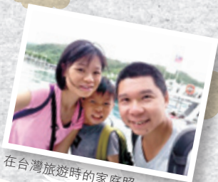
在台灣旅遊時的家庭照

兒子升上二年級後，老師告訴我們兒子出現「講大話」的情況。我和太太認為教育兒子不僅是學校的責任，身為父母亦應多花時間與兒子相處。那應由太太抑或我當全職家長呢？衡量到男孩成長不能忽略父親角色，因此我決定向上司辭職。