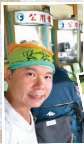
作者與兒子在台灣嘉義當背包客留影