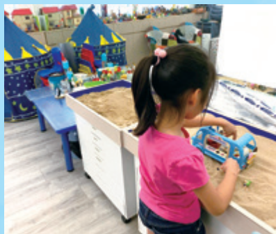
遊戲治療營造孩子打開心扉的空間