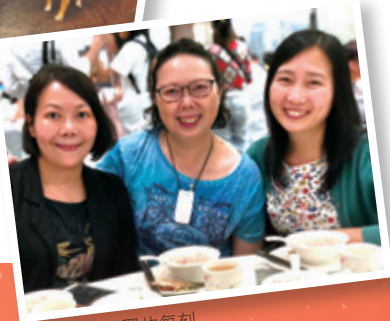
珍惜與友共聚的每刻