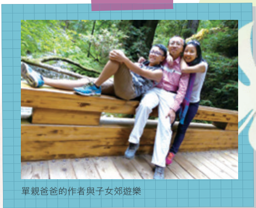
單親爸爸的作者與子女郊遊樂

有的燒菜很棒的，都能祝福很多人。所以記緊，看身邊的家人就如翠玉白菜，是要讓其發揮本有的紋理。