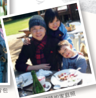
在澳洲旅遊時的家庭照