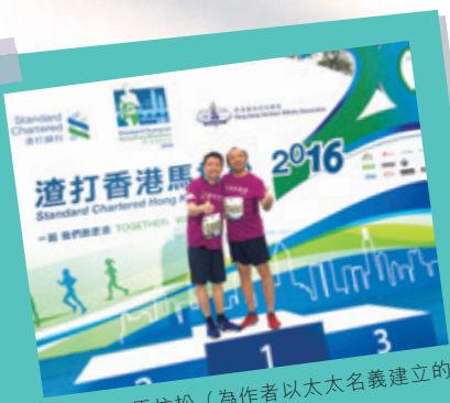
父子同跑馬拉松（為作者以太太名義建立的 乳癌康復資助計劃籌款）

我曾在臺北的國立故宮博物館欣賞鎮宮三寶之一的「翠玉白菜」。它本身是塊次等的玉，有著不少裂痕及瑕疵，若被雕造成當日時興的玉珮或花瓶，絕不會傳流至今。但雕匠順著玉石本有的裂痕及瑕疵雕鑿成翠玉白菜，終成為栩栩如生的藝術精品。這對一位單親爸爸來說是一趟很深刻的感悟：我們要相信每個人，包括兒女，就像翠玉白菜原來那塊次玉，都有缺點、瑕疵，卻也是其獨特之處。若我們只跟世界潮流，雕造其成花瓶玉珮，它的瑕疵就真只是瑕疵；若能發掘其獨特性，順著裂紋瑕疵去雕琢，則可成為一級國寶。這提醒我兒女就是翠玉白菜那塊玉，若順著上帝給我們的紋理去雕琢，人生可以非常燦爛、美麗。各人有不同崗位，有教法律的，