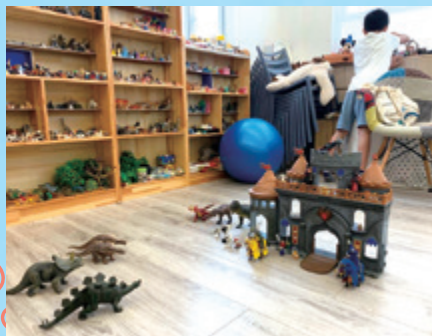
孩子藉遊戲治療疏理情緒