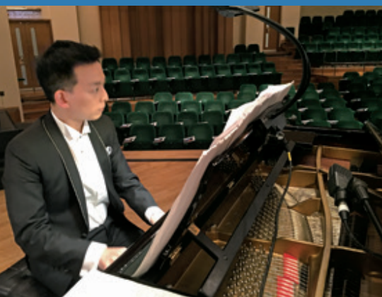
作者在上帝裡重尋生命價值，紓解了演奏壓力。