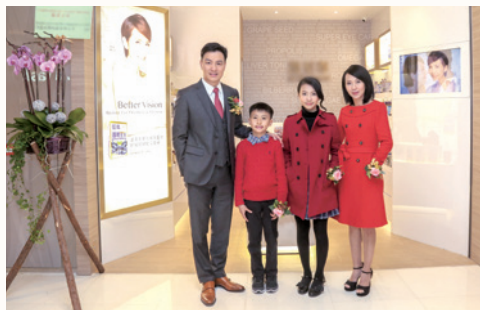
作者（左一）與家人攝於其公司

人，為你我釘十字架。人生的意義和價值來自上帝，我們不應敷衍地過一生，倒要把握上帝的恩典，這份恩典來自祂對我們的愛。