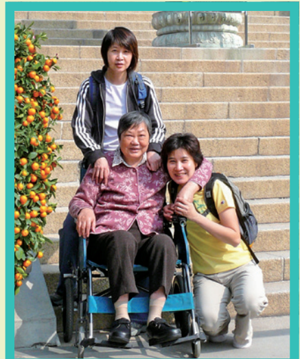
大姐（後立）二姐（前右）和媽媽開心出遊

及後媽媽進入病症晚期，語言能力明顯轉差，不能清楚表達自己的想法。但她的理解力並未退化，對別人說話的語氣、聲調、態度仍很敏感。她會專心聆聽，有時放鬆微笑，有時皺起眉頭。這階段，身體語言遠勝千言萬語，我們三姊妹總愛握著媽媽的肥手臂，靠著她的高背椅陪她看電視，吻吻她的臉頰，