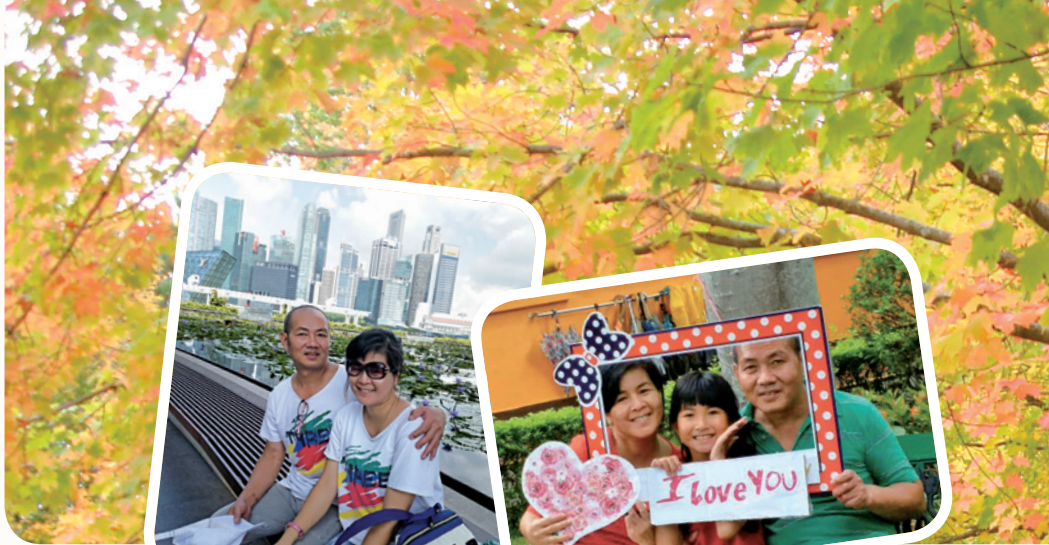
作者與太太旅遊時合照