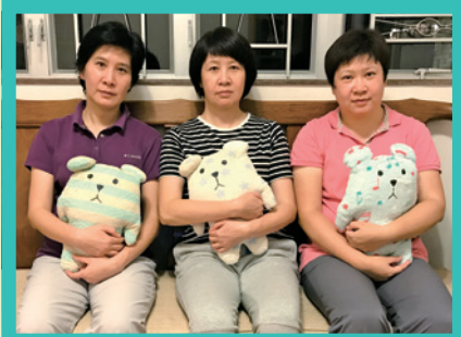
媽媽的溫暖常伴作者（右）、大姐（中）、二姐（左）