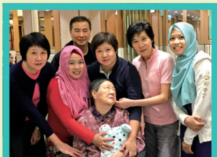
感恩我們能與媽媽一起走過這十四年相愛的路

我，因她的記憶和思緒停留在我們還是孩子的時候；若我還未回家，就不斷打發二姐外出找我，生怕我在街上玩耍未及回家吃飯。於是，我們送她一個BB布偶讓她照顧，穩定她的情緒。