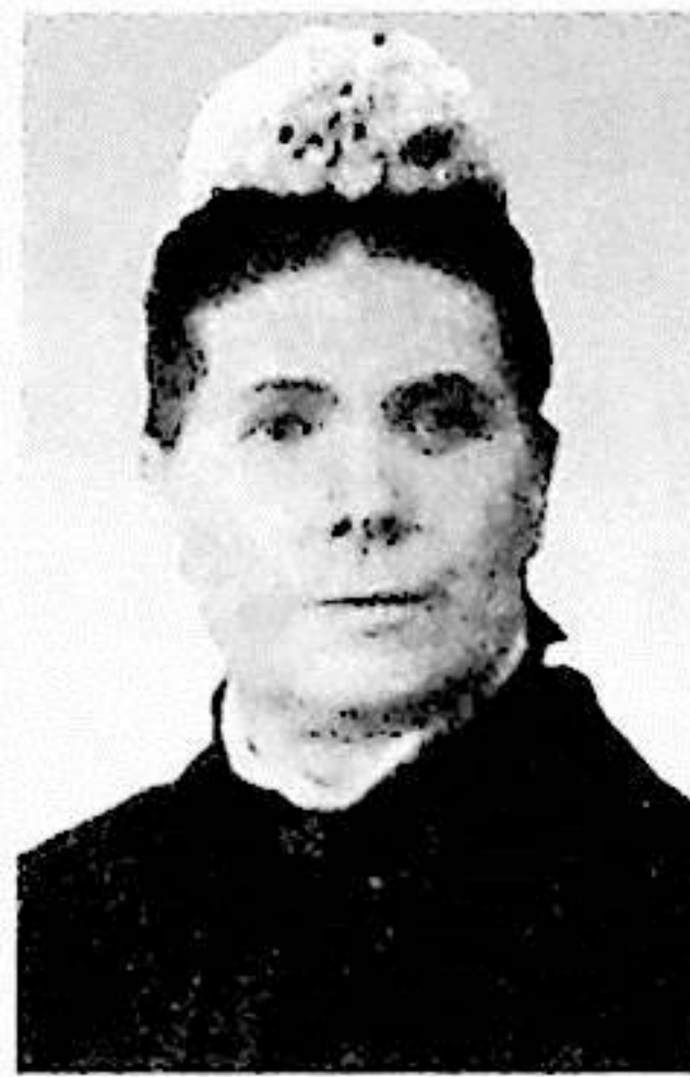
▲ 曹師母照片。 L22-076a