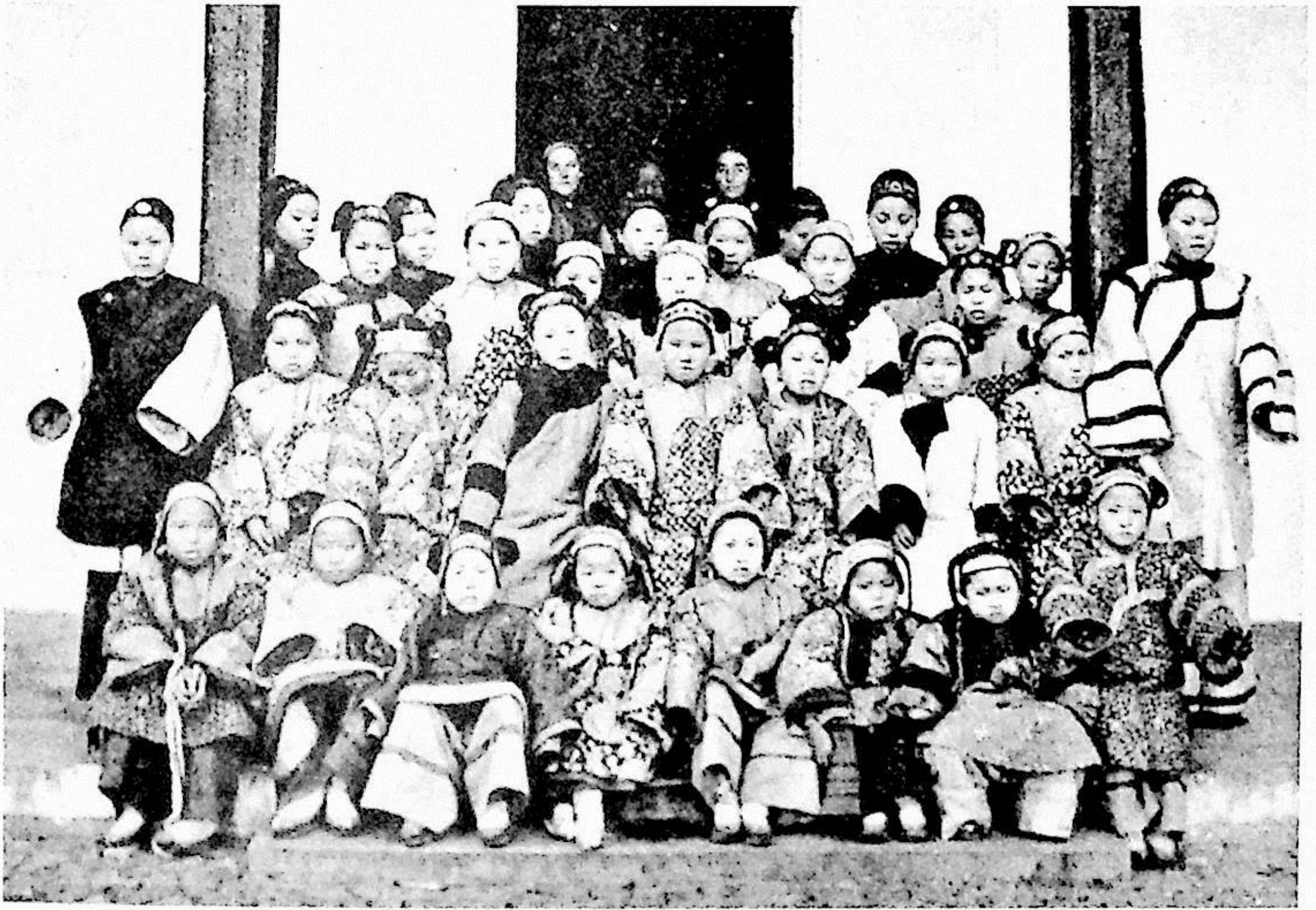
▲ 1900 年拍攝之溫州女學堂學生。 A00-086