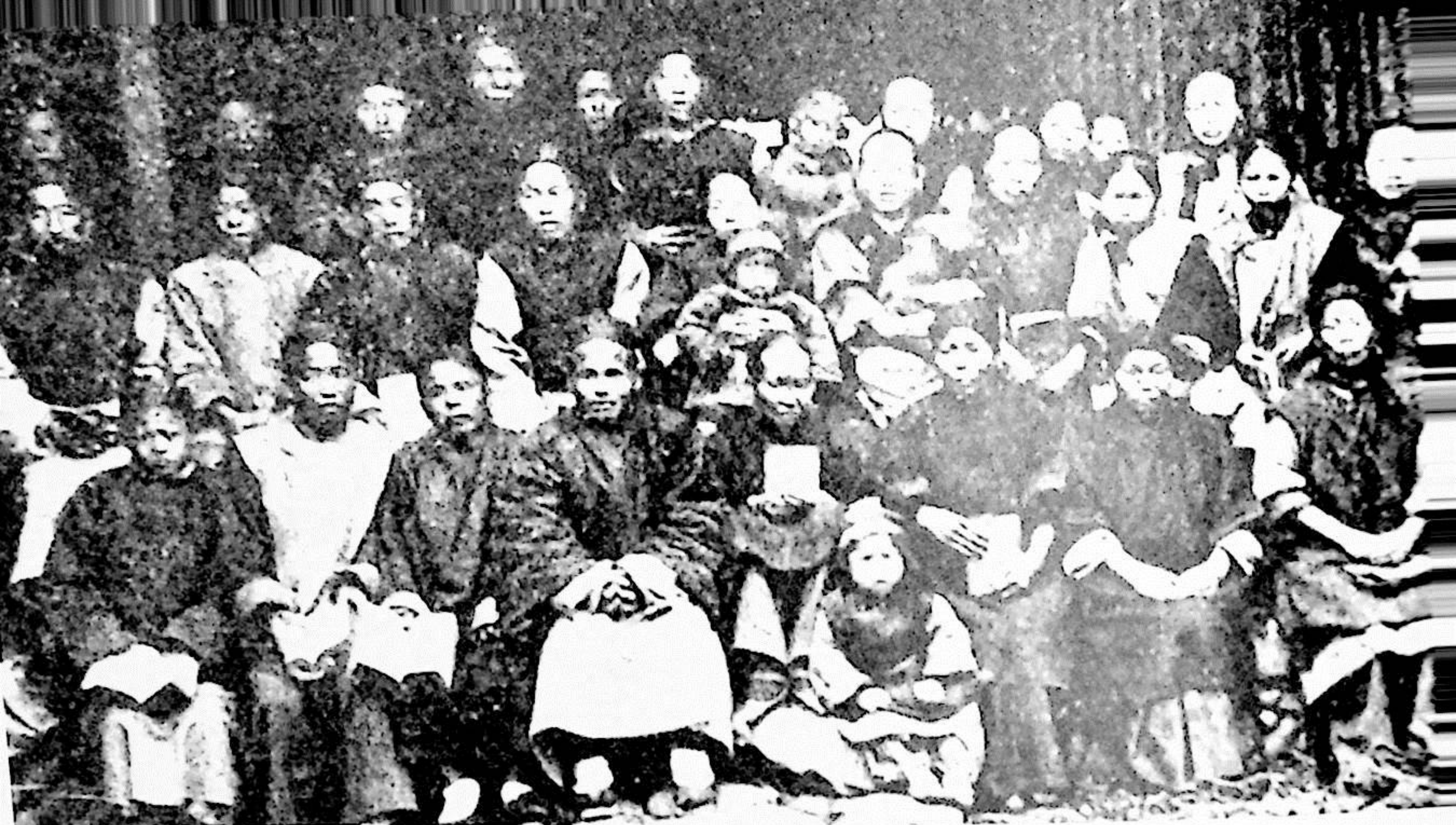
▲ 永嘉巽宅福音站一部分會友參加之聖經學校。L02-104a